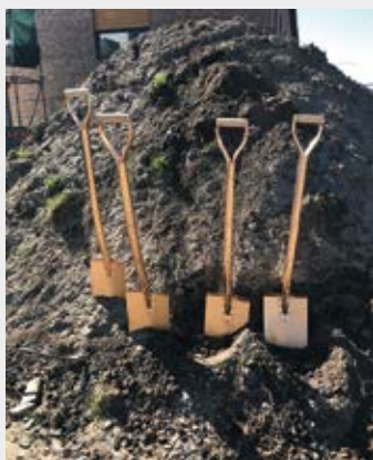
I april påbörjades nybyggnationen i Folkparken/Julivallen med inflytt under 2020.

Den 15 april togs det första spadtaget till vår nybyggnation i Folkparken/Julivallen. Det blir tre fastigheter, varav två stycken byggs som trygghetsboende. Inflyttning under vår och höst 2020. Är du intresserad anmäler du dig på Mina Sidor så skickar vi mer information till dig under året.