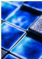
Verk och foto: Haruhiko Kaneko.

Ny dubbelutställning på Keramiskt center. I Galleriet kommer mer än hundrafemtio antika och unika föremål att berätta om den japanska keramikens dramatiska historia – starkt förknippad med bland annat samurajkulturen. Keramiskt Center, Gärdesgatan 4B, Höganäs. http://keramisktcenter.se