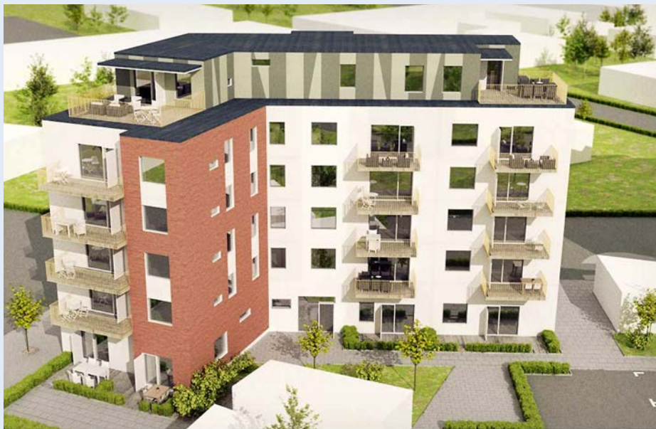
Månstorp 32, etapp 1. Långarödsvägen 18 A-B med beräknat inflyttningsdatum den 1 maj 2018.

Det vi framförallt är stolta över är att vårt stora fokus på energi- och miljöarbete ger resultat. Bland annat har vi minskat våra koldioxidutsläpp med 15 % jämfört med 2016. Vi har också minskat vår förbrukning av fastighetsel, mycket tack vare våra belysningsprojekt.