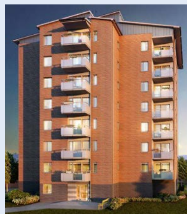
Sjöcrona, etapp 3, Pumpgatan. Beräknad inflyttning till mars/april 2019.

Att få vinst är viktigt för att vi även framöver ska kunna fortsätta att underhålla våra befintliga fastigheter, men också för att vi ska kunna bidra till att utveckla Höganäs kommun genom att bygga nya bostäder.